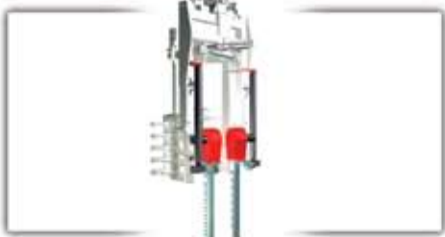
Oldalsó vágóegység - párban ▲ ■