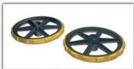
Görgő tárcsák - párban ▲ ■