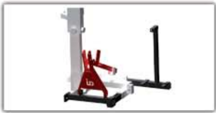
Traktor hátsó 3 pontra építő készlet ▲ ■