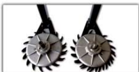
Befejező metszőtárcsa - párban ▲