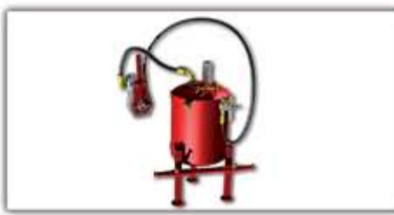
Saját hidraulika rendszer (60 l) ▲ ■