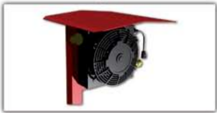
Olaj hűtő ▲ ■