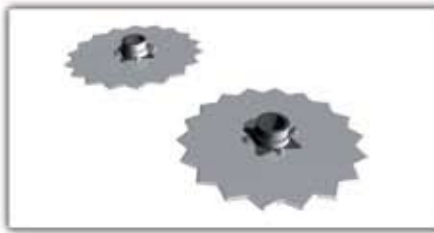
Törő tárcsa - párban ■