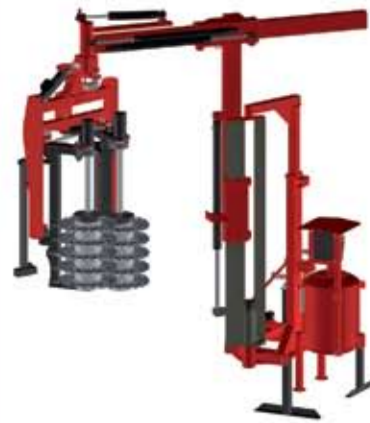
EFIC - 3 munkahelyzet