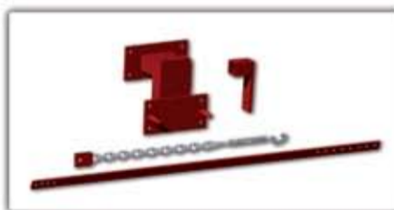
Traktor frontra építő készlet ▲ ■