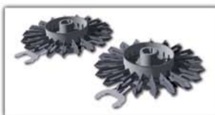
Standard vágótárcsa - párban ▲