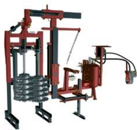
EFIC - 2 munkahelyzet