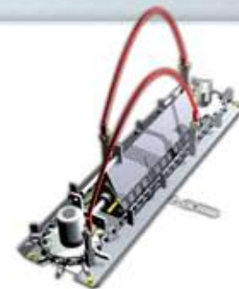
Boltzódás gátló készlet Ref. KAC