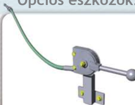
A kiömlő nyílás vezérlése a traktor kabinból (kézi) Ref. SIR