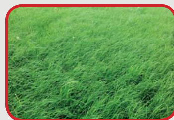
Vredo után (31. nap)