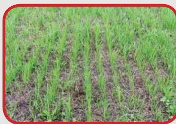
Vredo alatt (13. nap)