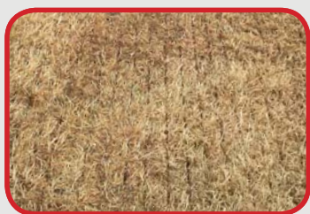
Vredo előtt (1. nap)

A legújabb kutatások azt mutatják, hogy a vetőgép betakarítás után az olyan köztes termények vetésére is használható, mint kukorica és gabona.