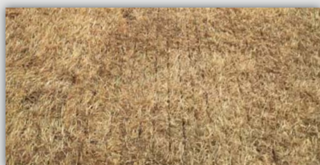
Vredo előtt (1. nap)

Ha számunkra és vásárlóik számára fontos a minőség, teljesítmény és az eredmény, akkor a Vredo Agri Twin sorozat legprofesszionálisabb munkagépe éppen a megfelelő ehhez.