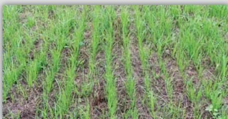
Vredo alatt (13. nap)