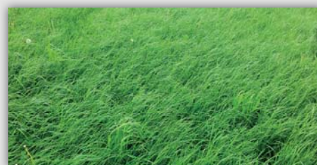
Vredo után (31. nap)