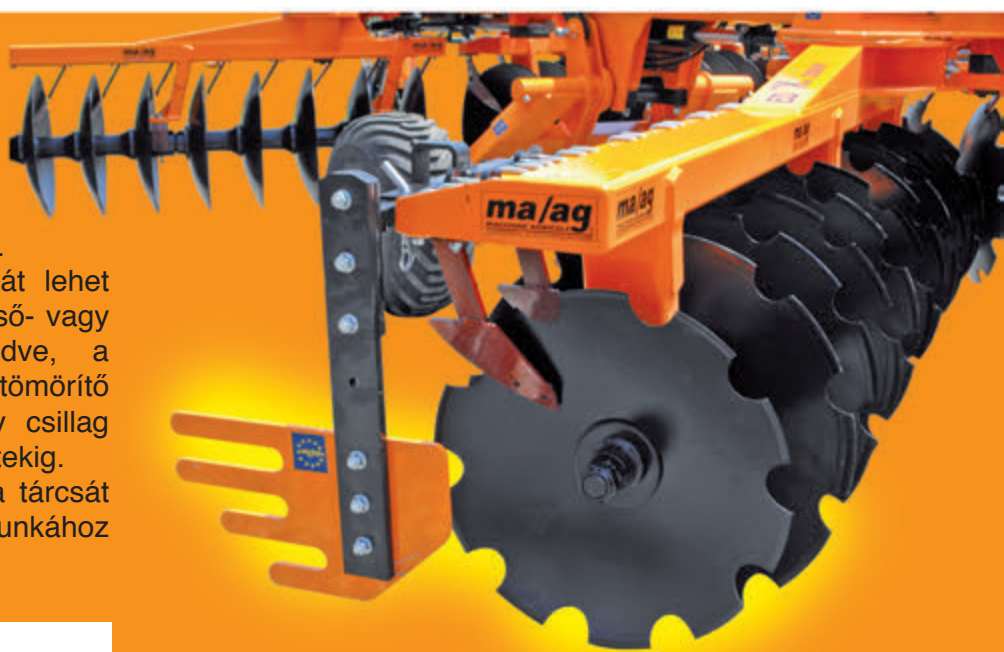
Szélső terelő lemez

Amunkagéphez különféle kiegészítő felszerelések vásárolhatók, melyeket a hátuljára lehet illeszteni. Ezek használatával többféle munkát lehet elvégezni egyszerre: az egyszerű cső- vagy laposacélpálcás hengerektől kezdve, a spirális hengereken keresztül, a tömörítő hengerekig vagy a hullámos vagy csillag alakú tárcsákkal kombinált szerkezetekig. Mindez azt a célt szolgálja, hogy a tárcsát az adott talajtípushoz és a kívánt munkához lehessen igazítani.