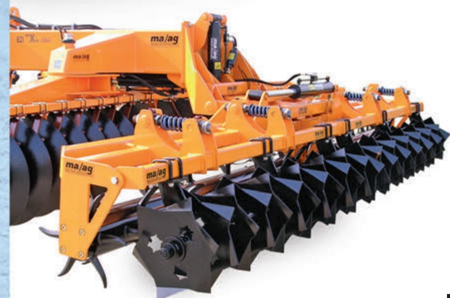
Hátsó, hidraulikus kombinált rög aprító-lezáró egység