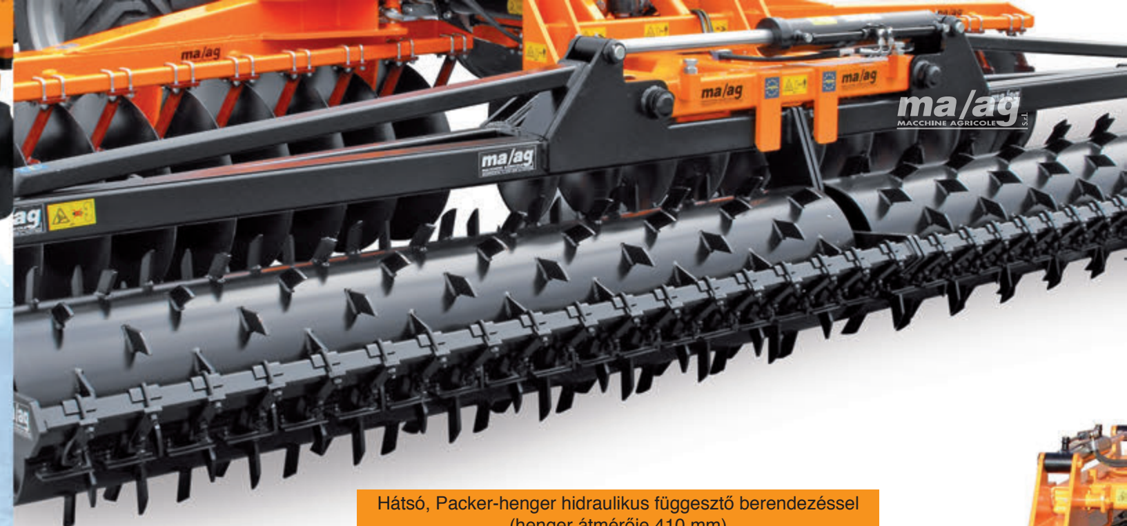
Hátsó, Packer-henger hidraulikus függesztő berendezéssel (henger átmérője 410 mm)